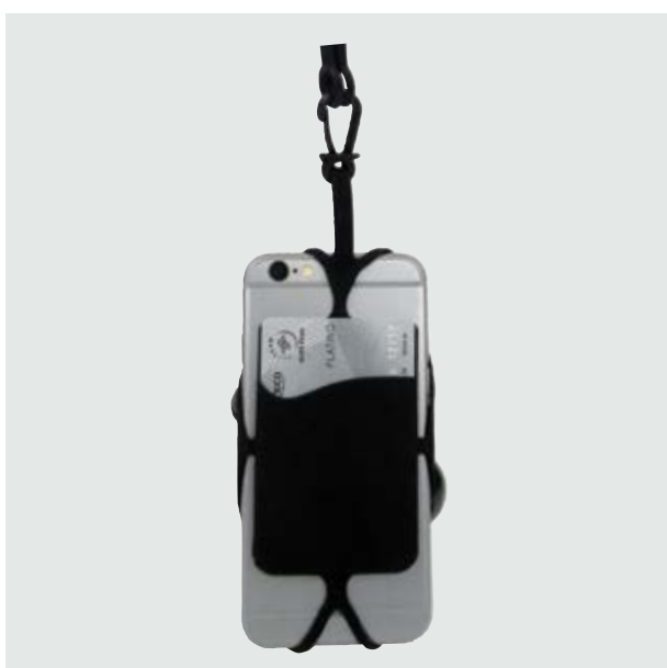
TEC 264 Porta-Celular Kelvin