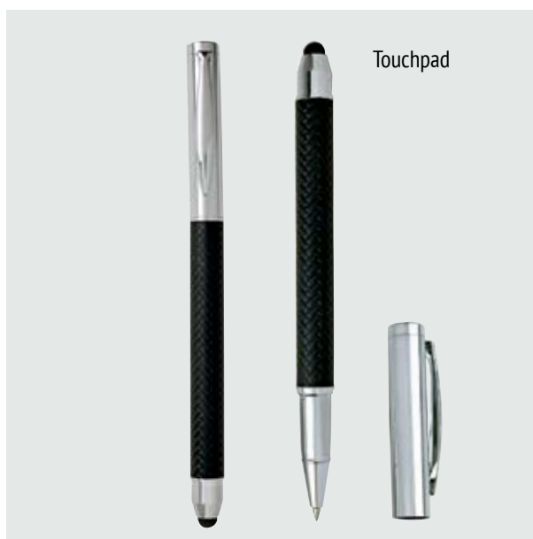
BOL 520 Bolígrafo Bernini