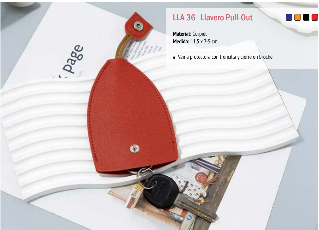
LLA 36 Llavero Pull-Out

Material: Metal y Curpiel Medida: 12.1 x 2.2 cm.