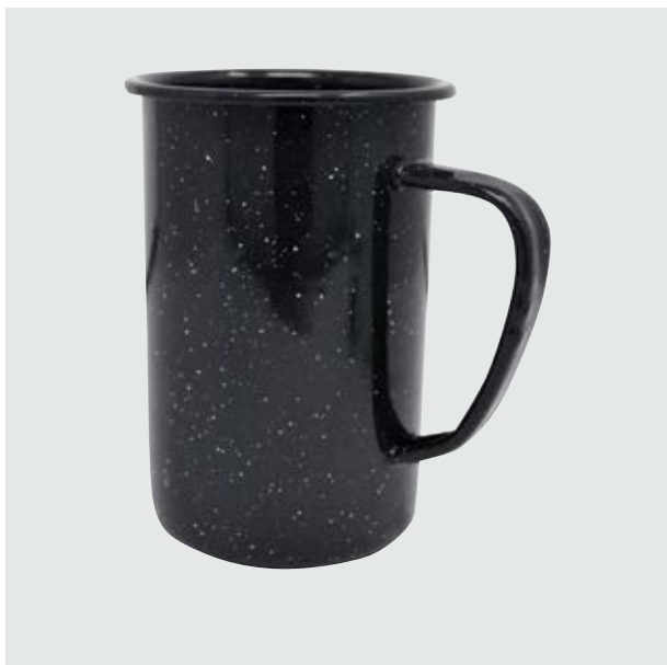
TH 213 Tarro Cervecerero