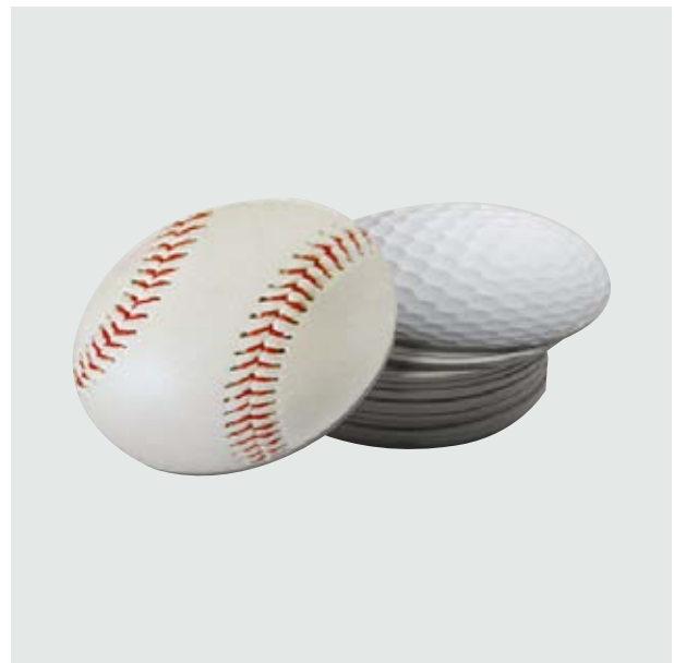
DEP 04 Coasters Deportivos

Material: Cartón Medida: 10 cm de diámetro