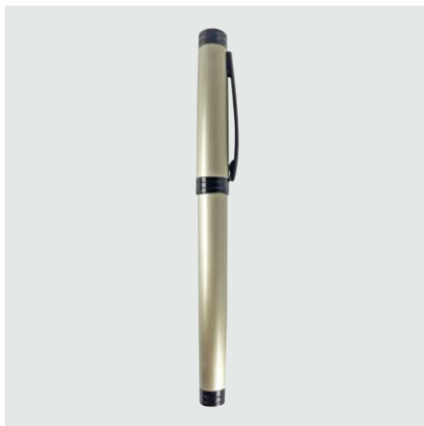
BOL 528 Bolígrafo Zener