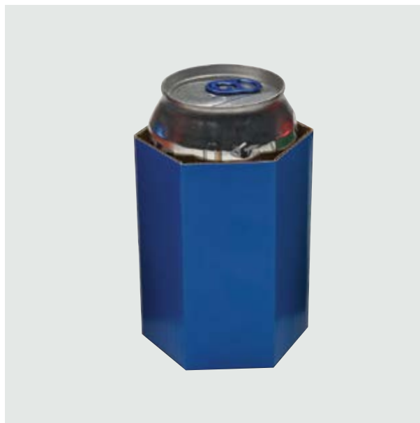
TH 306 Card Can-Holder