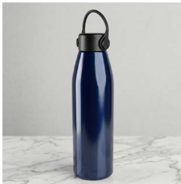
TH 05 Termo Arce