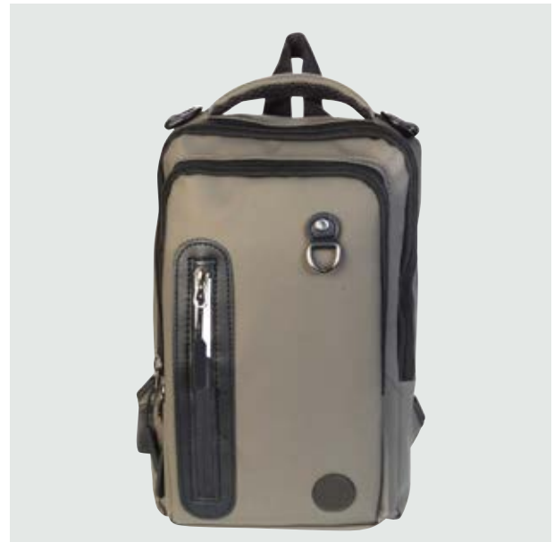
MAL 211 Backpack Baylor