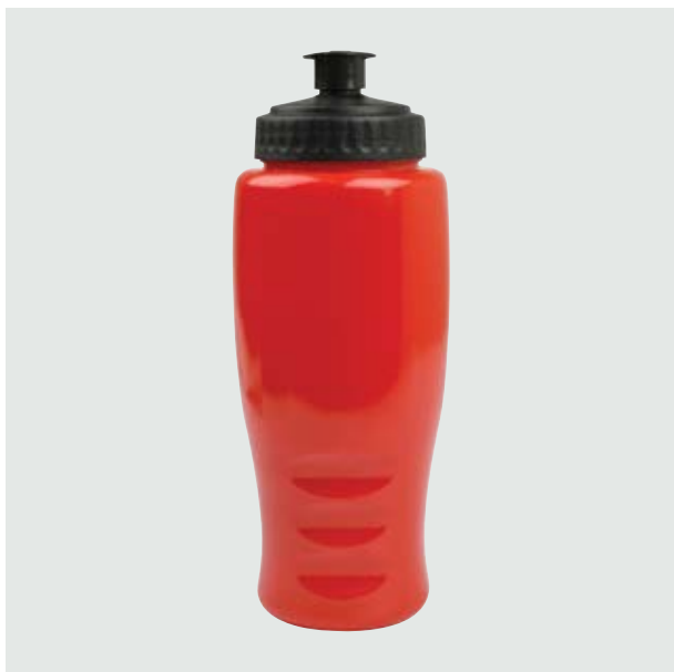
TH 101 Cilindro Cica Sólido