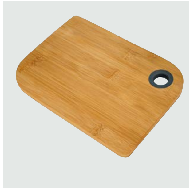
CAS 51 Tabla para picar Columba