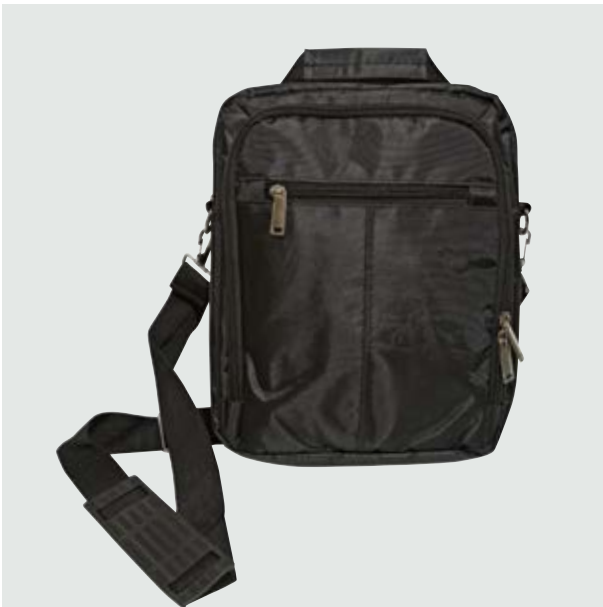
MAL 529 Bandolera Agasi