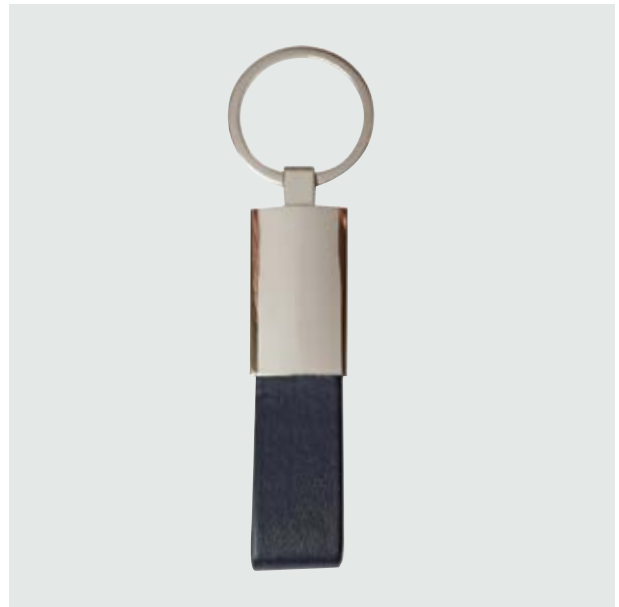
LLA 35 Llavero Rectangular Curpiel