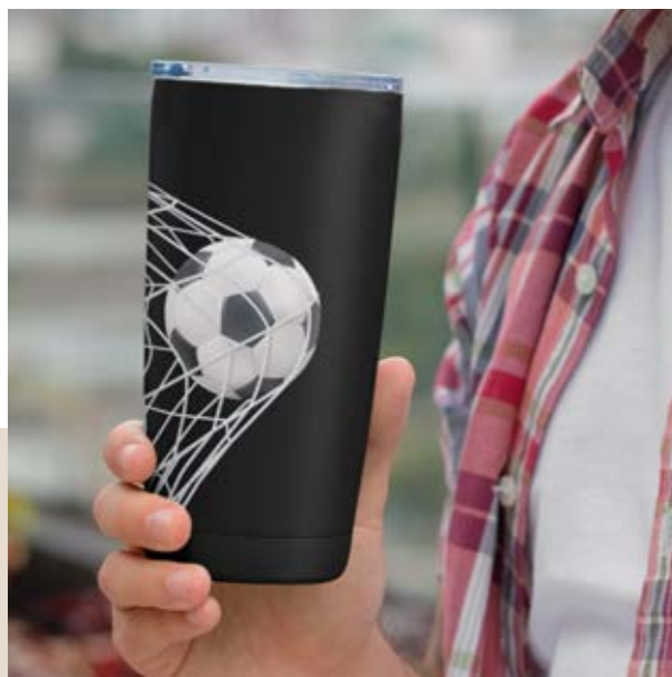
TH 07 Termo Vitex