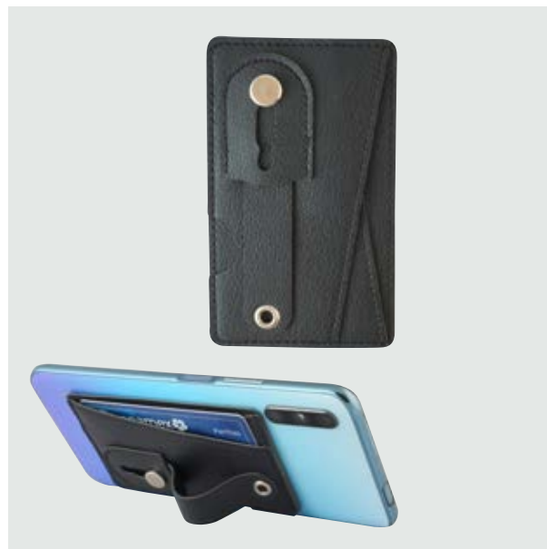
TEC 244 Tarjetero Hook

Material: Plástico y Silicón Medida: 6.2 cm diámetro