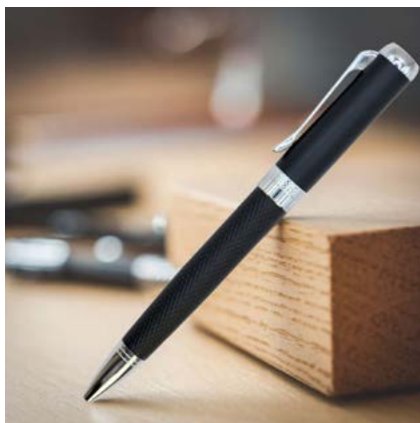
BOL 524 Bolígrafo Lautrec