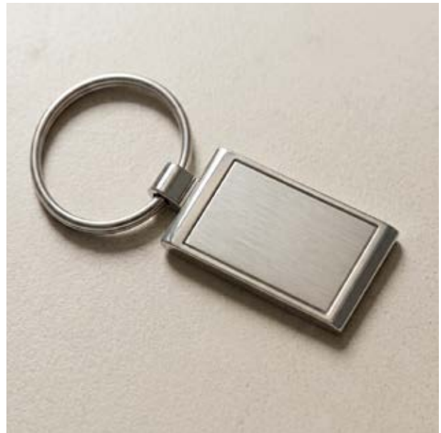
LLA 22 Llavery Rectangular Sencillo Plano