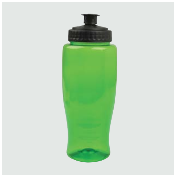
TH 102 Cilindro Cica Traslúcido