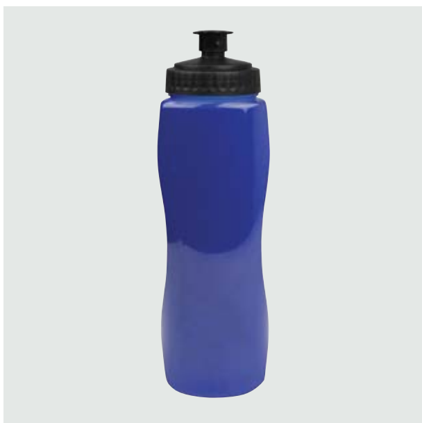
TH 104 Cilindro Ebano Sólido