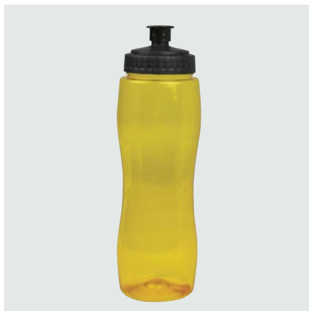
TH 105 Cilindro Ebano Traslúcido