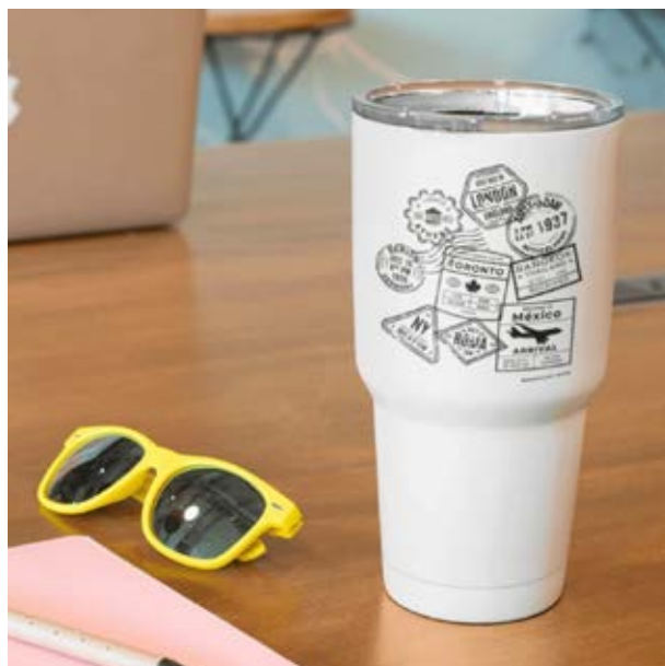
TH 06 Termo Pomelo