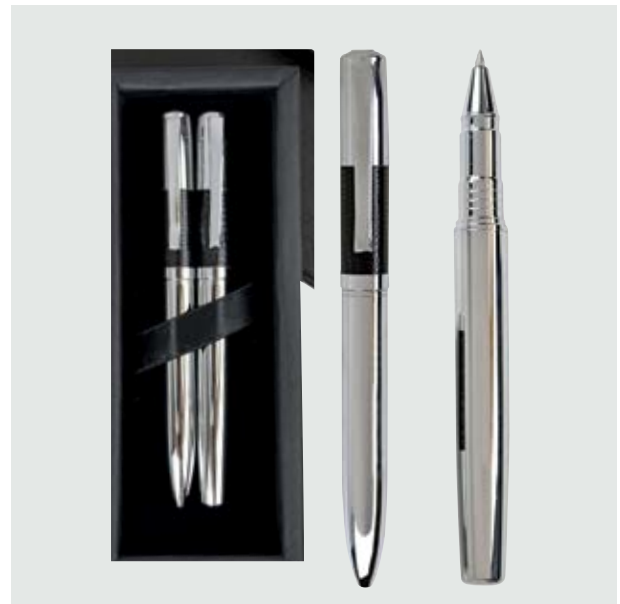
BOL 502 Set Bolígrafos Klee