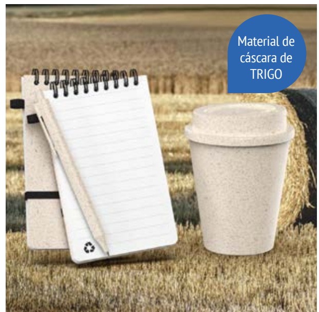
TH 215 Set Trigal