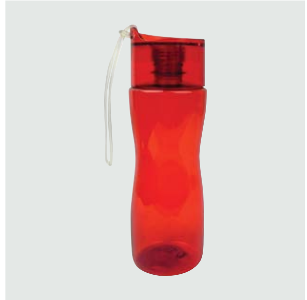
TH 113 Cilindro Junior Color