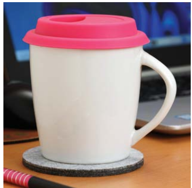
TH 204 Tazón Volca