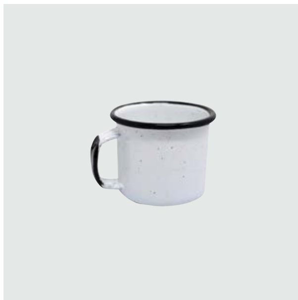
TH 212 Shot-Tequilero