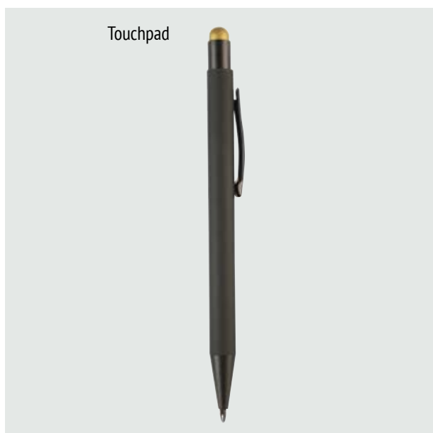
BOL 519 Bolígrafo Kandinsky