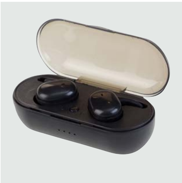
TEC 03 Audífonos Franklin ■