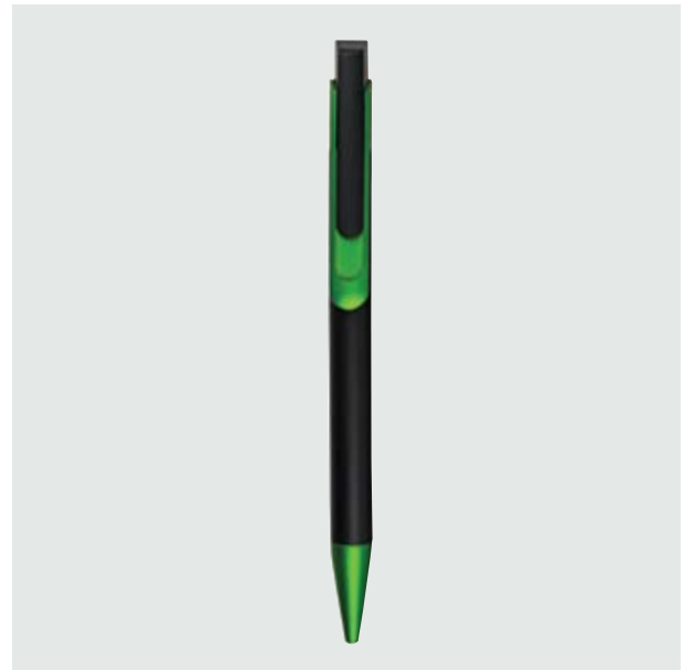
BOL 107 Bolígrafo Tintoretto