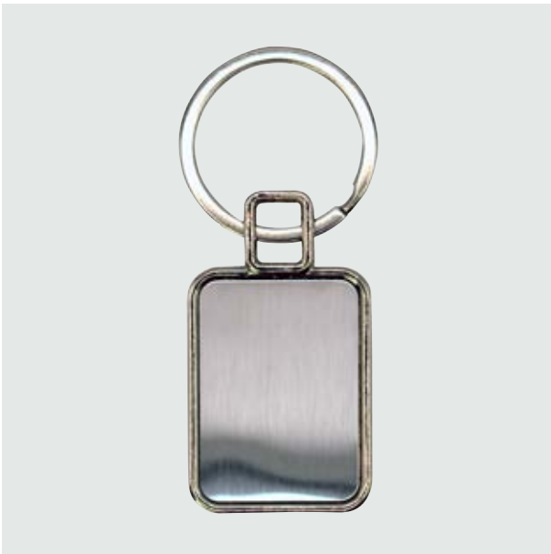
LLA 23 Llavero Cuadrado Plano