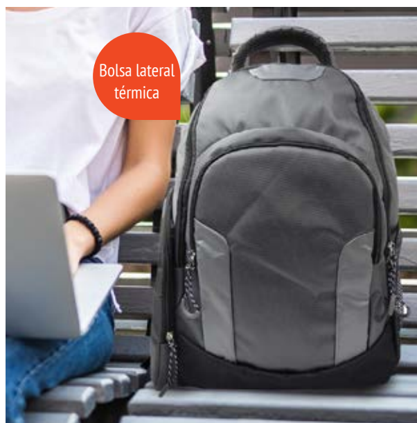
MAL 616 Backpack Sampras