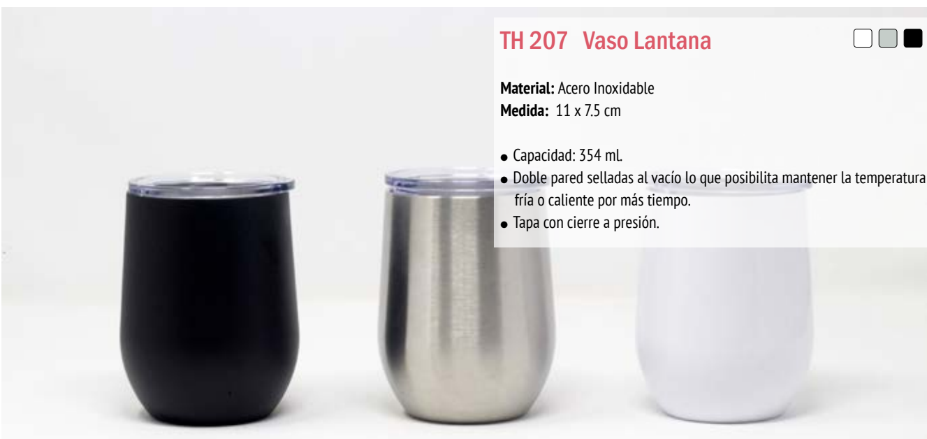
TH 207 Vaso Lantana