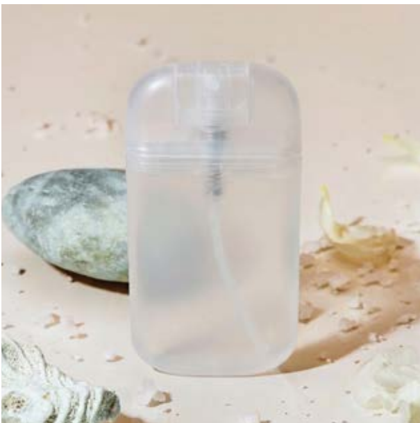
SAL 05 Oxy Sanitizer