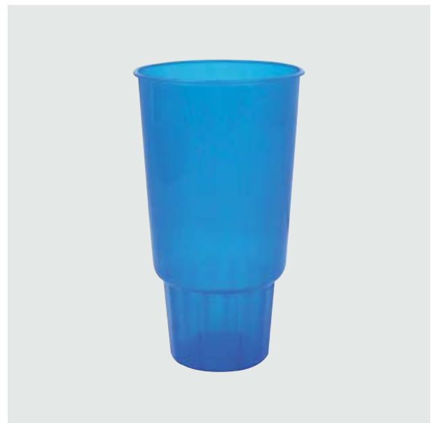
TH 209 Vaso Promocional