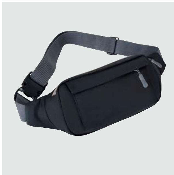
MAL 223 Cangurera O'Neal